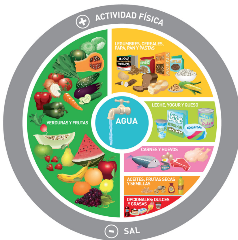
Gráfico de las Guías Alimentarias para la Población Argentina

Dentro de los 10 mensajes destacados de las GAPA se encuentra “CONSUMIR DIARIAMENTE LECHE, YOGUR O QUESO, PREFERENTEMENTE DESCREMADOS”.